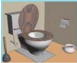
Foto: hedendaags toilet